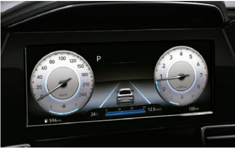
Pantalla de clúster a todo color de 10,25"