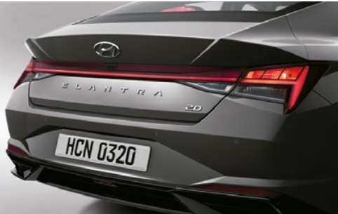
Faros posteriores bombilla + led