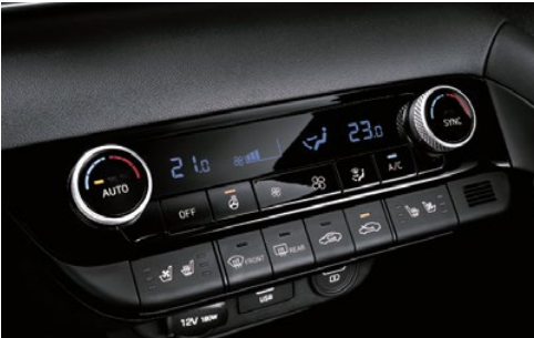
Aire acondicionado automático dual