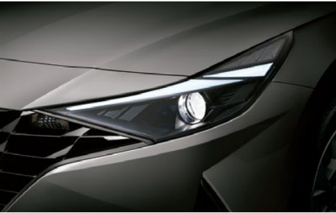
Faros delanteros de proyección