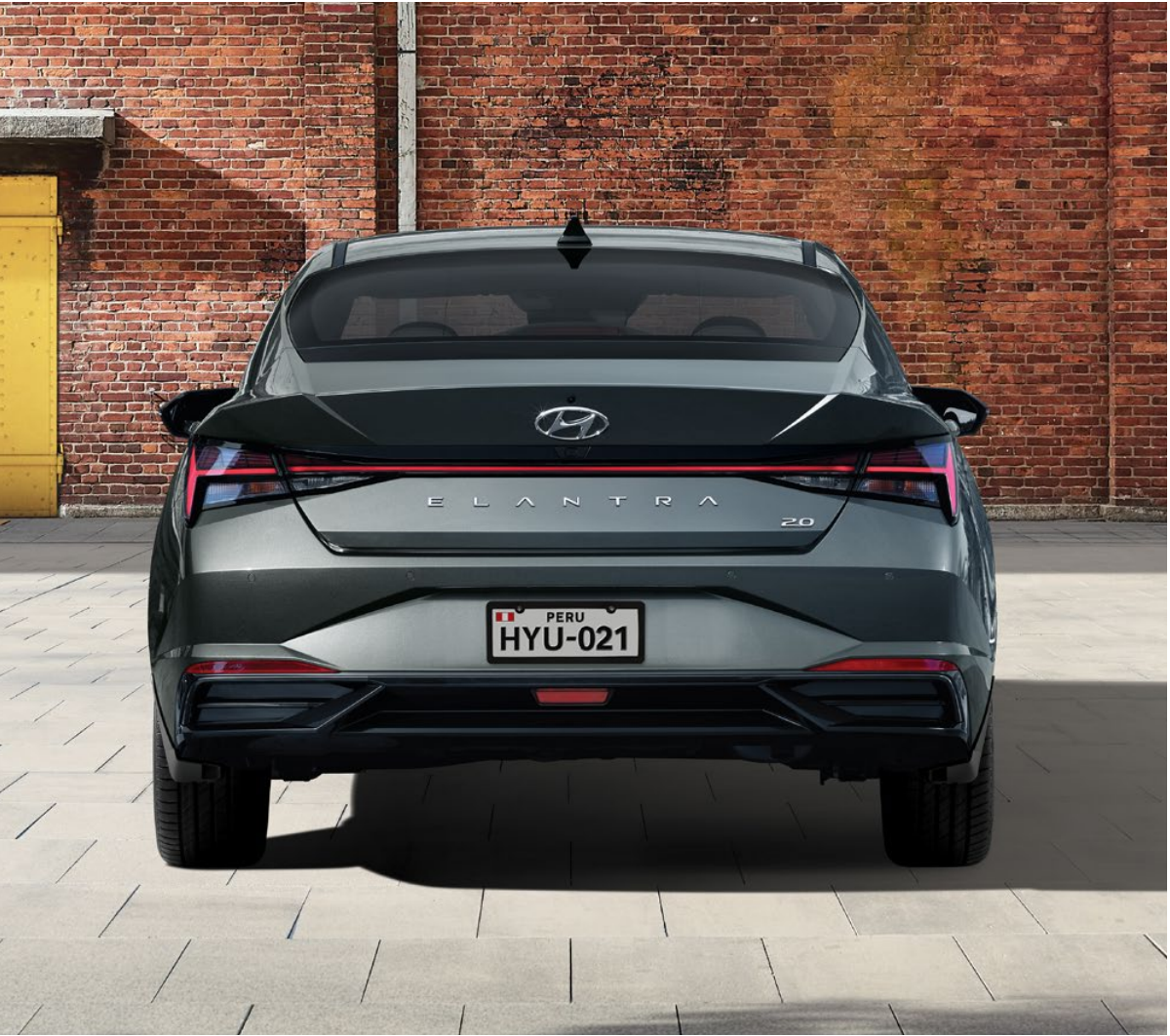
Faros posteriores en forma de H