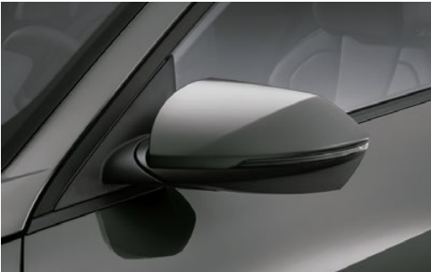
Retrovisores laterales exteriores (calefactados, plegado automático, indicadores led de dirección)