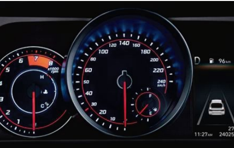
Tablero de instrumentos con pantalla LCD de 4,2"