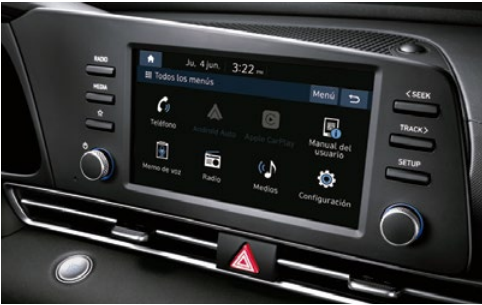
Sistema de audio con pantalla de 8"