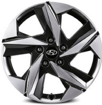
Aros de aleación de 17"