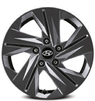
Aros de aleación de 16"