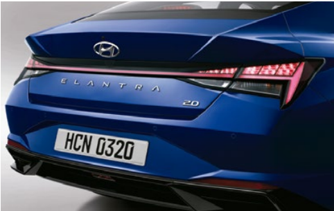
Faros posteriores led