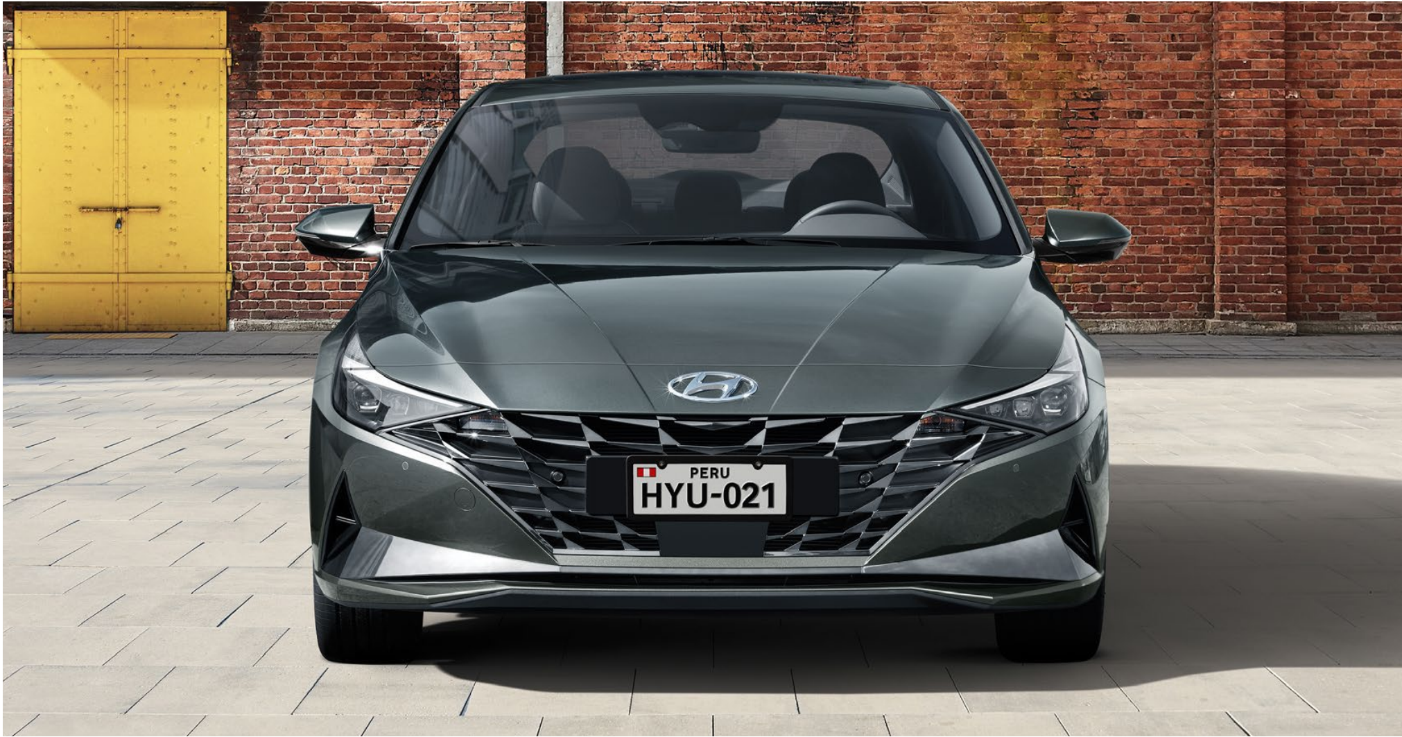
Parrilla con Parametric Jewel Pattern

El diseño estereoscópico “Parametric Jewel Pattern” enfatiza el efecto tridimensional de la parrilla frontal, haciéndola parecer una gema tallada de forma exquisita, y los faros delanteros llamativos y alargados, se unen para darle al Elantra su aspecto deportivo frontal. El alerón anguloso en el maletero y la luz trasera multifuncional integrada, que representa a Hyundai con su diseño distintivo en forma de H, ayudan a crear un aspecto posterior futurista de alta tecnología.