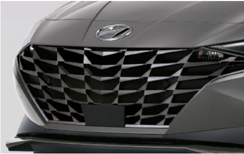
Parrilla del radiador cromada