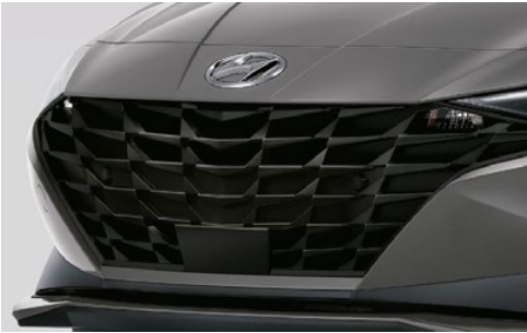
Parrilla del radiador negra