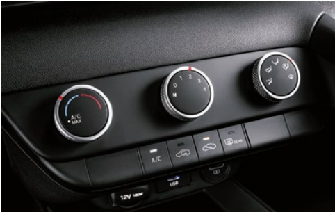
Aire acondicionado manual