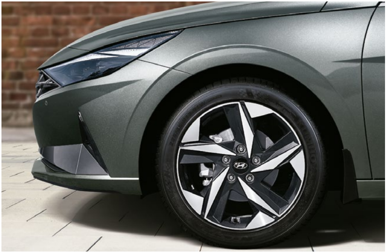
Faros led Neumáticos y aros de aleación de 17"